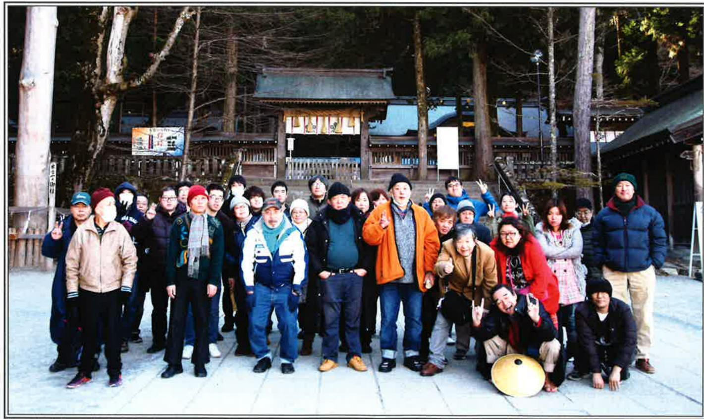
→ 諏訪大社での記念撮影