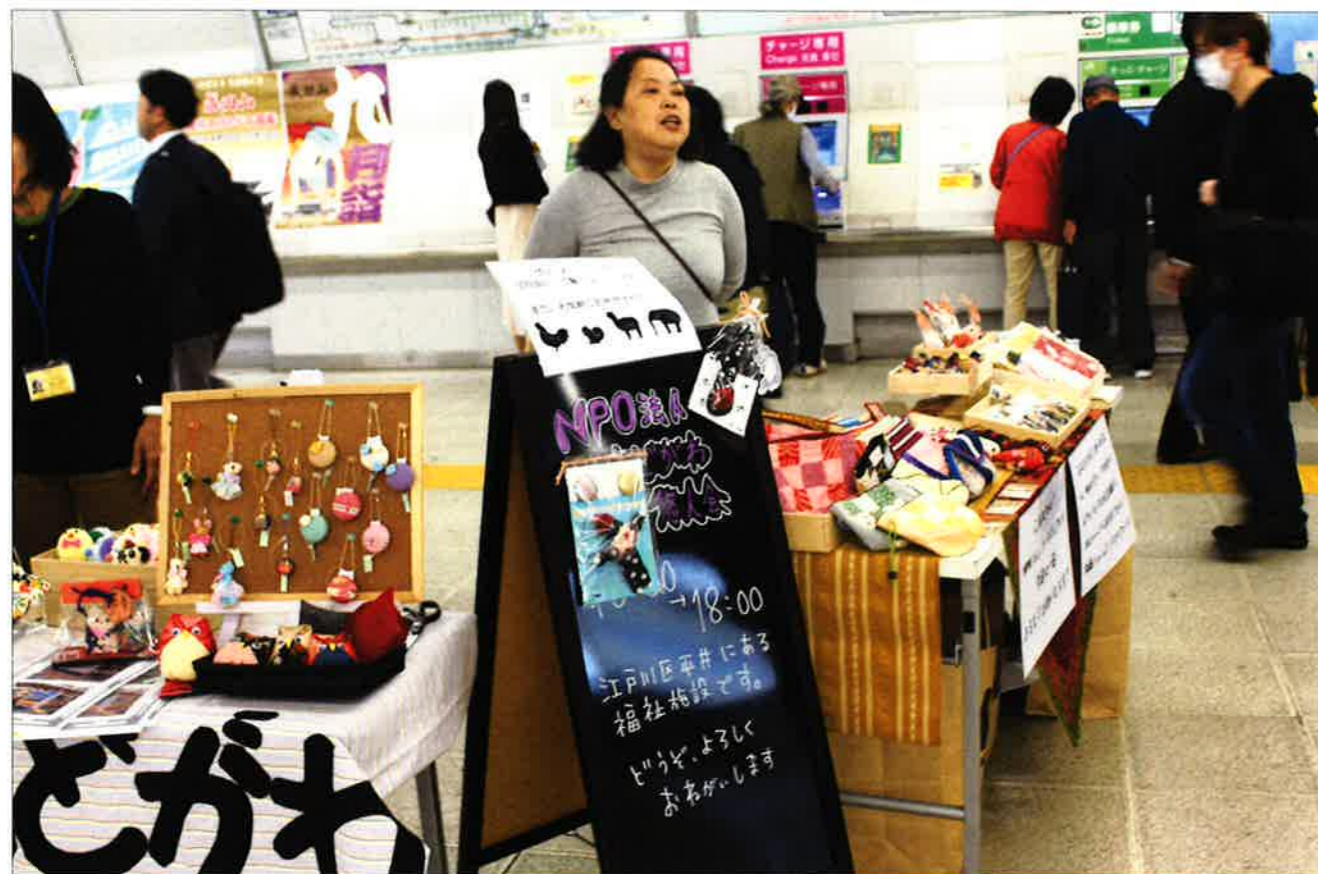
売り子として頑張るSさん(真ん中↑)