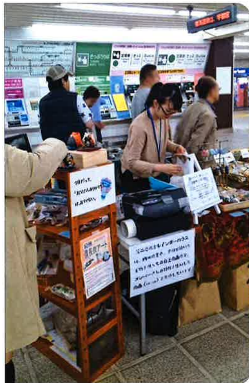
↑第二悠遊舎えどがわ レインボーハウスのブース