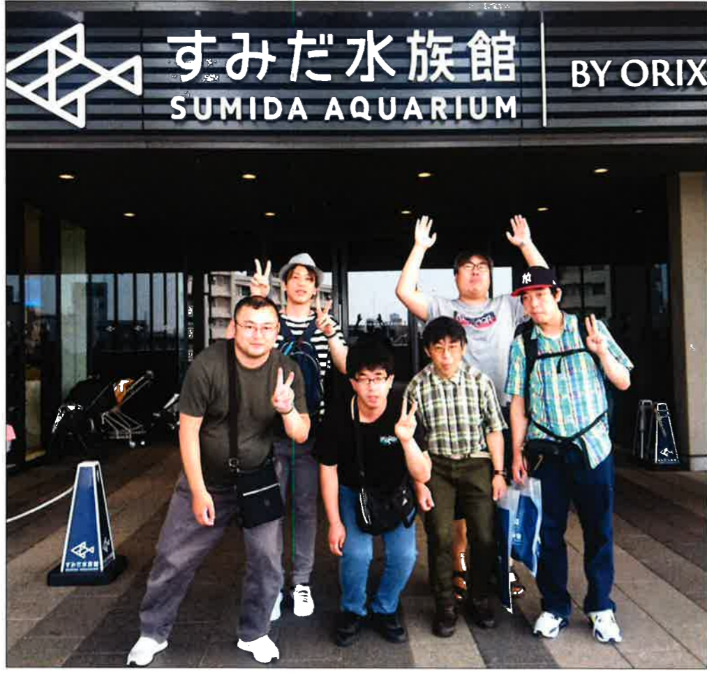
■6月22日、墨田区押上の東京スカイツリータウン・ソラマチ5階と6階にある「すみだ水族館」へ見学に行ってきました←