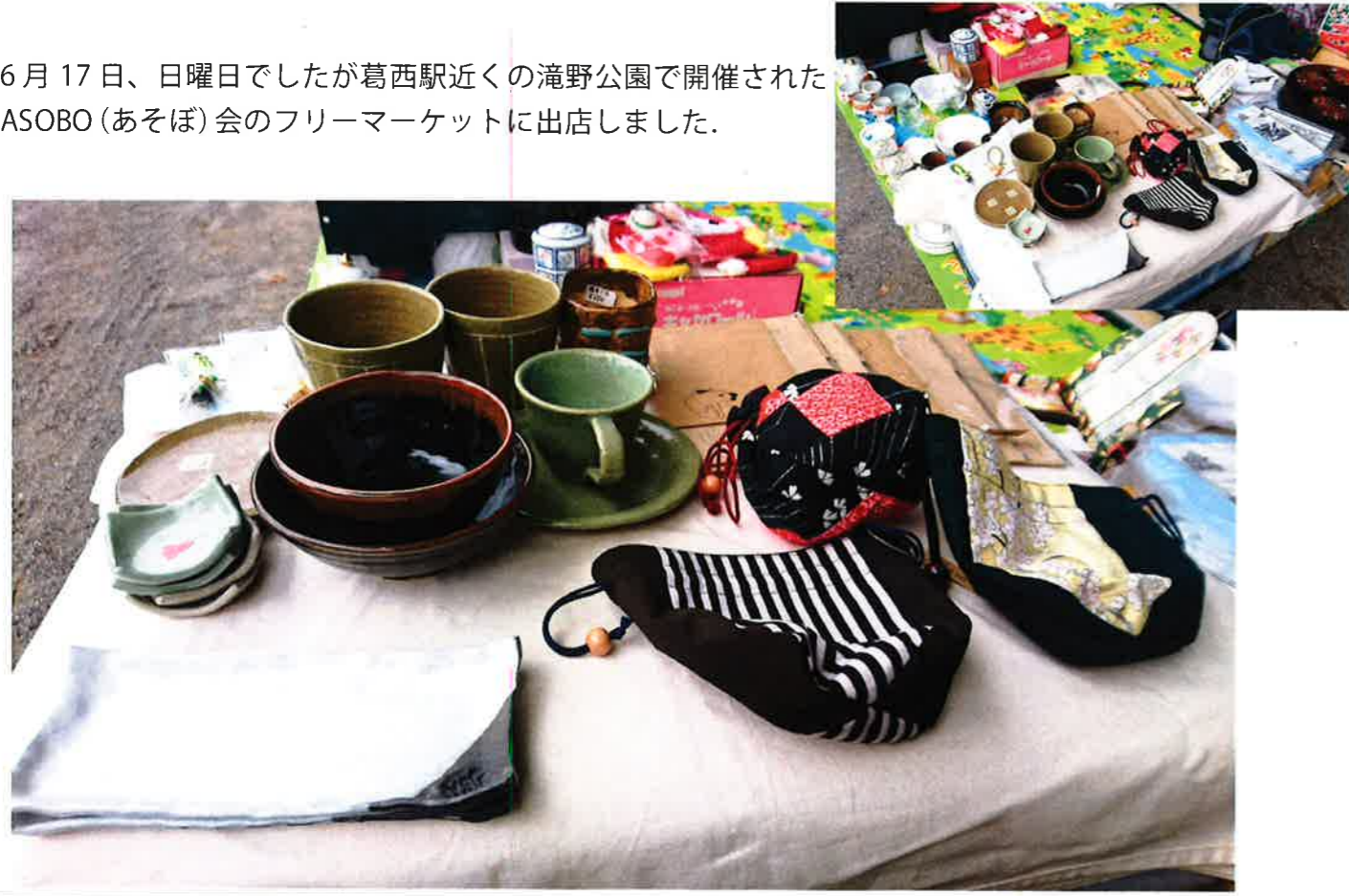
6月17日、日曜日でしたが葛西駅近くの滝野公園で開催されたASOBO(あそぼ)会のフリーマーケットに出店しました。