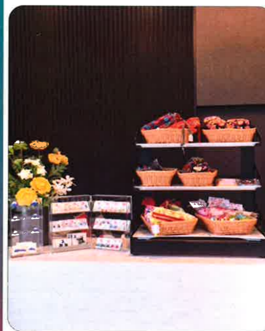
↑フロントカウンターでの販売風景

是非、都内のホテルで第二悠遊舎えどがわの商品を見かけた方がいましたら、是非お手に取ってご覧いただければ幸いです!