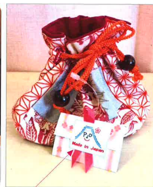
●紐の所に作成者の紹介文、連絡先(第二悠遊舎えどがわと販売元であるOnly OneのURL)、メッセージを貰えたら嬉しい旨を記載したカードを付けています。