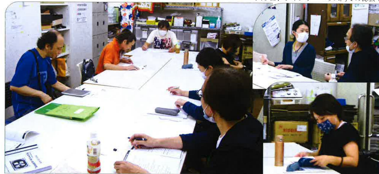
↓18日、レインボーハウス内での総会↓