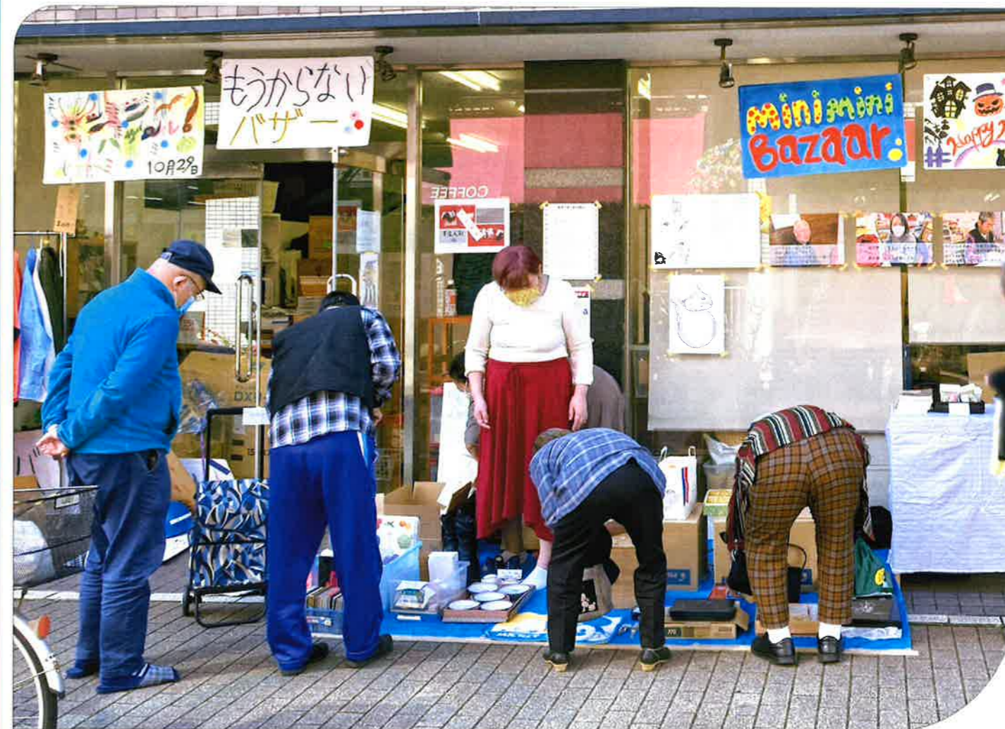
↑会場は“レインボーハウス”（悠遊舎えどがわの斜め向かい） 第二悠遊舎えどがわ（就労継続支援B型事業所） 江戸川区平井1-6-10 チェルシー泉1階