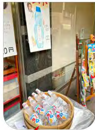
ラムネが大人気でした!