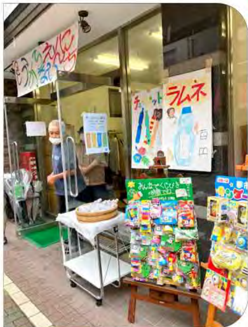
第二悠遊舎えどがわ ↓“レインボーハウス”↓