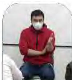
↑質問や感想などに 応える豊島監督