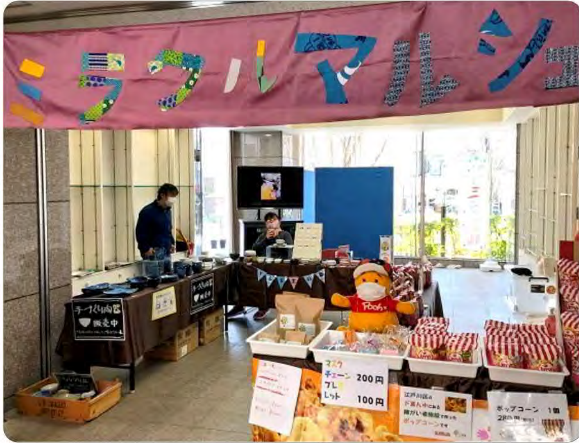
↑↓ YSG【土の夢】の販売ブースです

およそ2年ぶりの開催となる江戸川区役所での販売会 “ミラクルマルシェ：江戸川区就労支援事業所 販売会”に YSGと第二悠遊舎えどがわが参加しました!