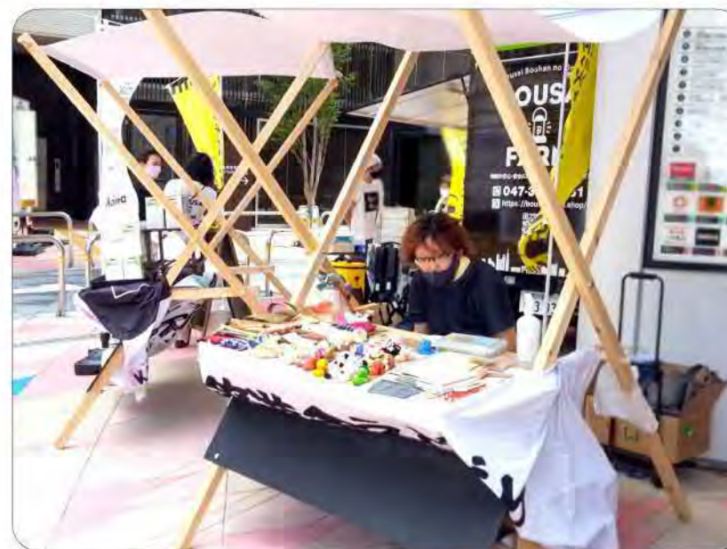
●隣のテントだったら、もう少し売れたかも(^_^)

●十～二十代、働いていた時にも遊びに行ったりしていた場所なので懐かしかった。 駅周辺で立地が良く色々な分野の人が集まってお祭りみたいでリラックスしている感じがした。販売中の風や消防の音等、自然にはかなわないと思った。それでもチラシが配れて良かった。受け取って貰えて繋がりが出来て販売は貴重な体験でした。