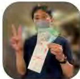
↑勝利のVサイン 年末ジャンボも頼むね!