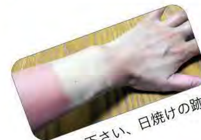
見て下さい、日焼けの跡(泣)

●大人気の編みももクリップ。種類は色々ありますが今回は“犬”押し。狙いの中のお客様から“このワンちゃん、可愛い、もっと欲しい！”とリクエストも(^_^)