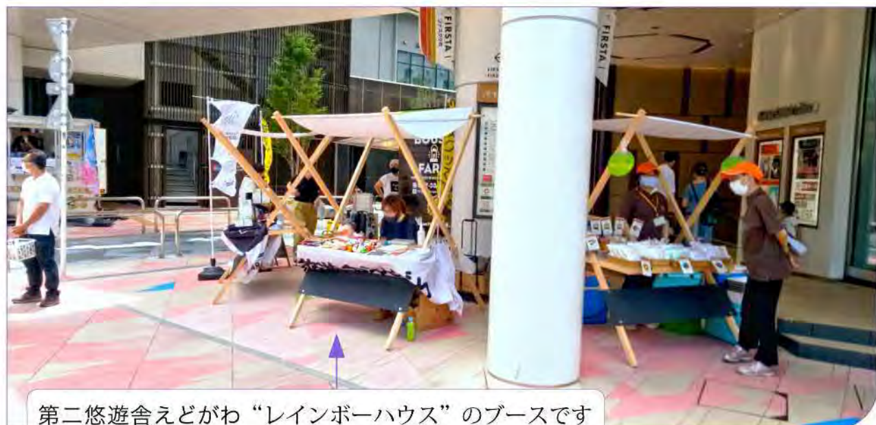
第二悠遊舎えどがわ“レインボーハウス”のブースです

そんな中でもKOITTOの皆さんがテントの補強を下さったり、初めましてのお客様から“また来るわよね？”とお声かけ頂いたり、小岩駅構内で販売をしていた時にご利用頂いたお客様と再会する等、皆様に励まされながらの嬉しい一時となりました。